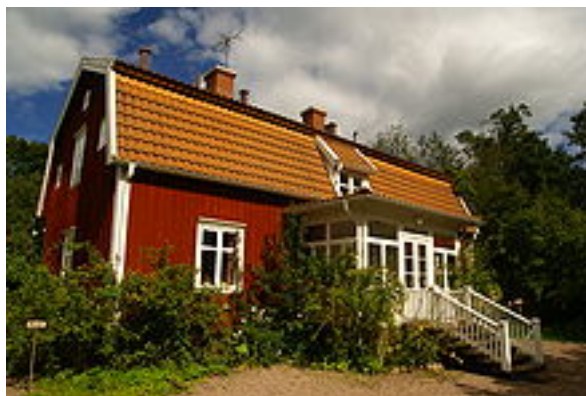
Astrid Lindgrens barndomshem

Namn på kretsens valda ledamöter till kommande styrelsen ska senast 9 april anmälas till valberedningen.